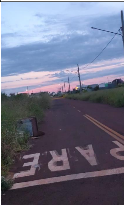
Rua Firmino Augusto da Costa