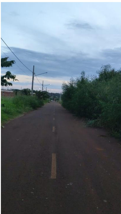
Rua Dom Redovino